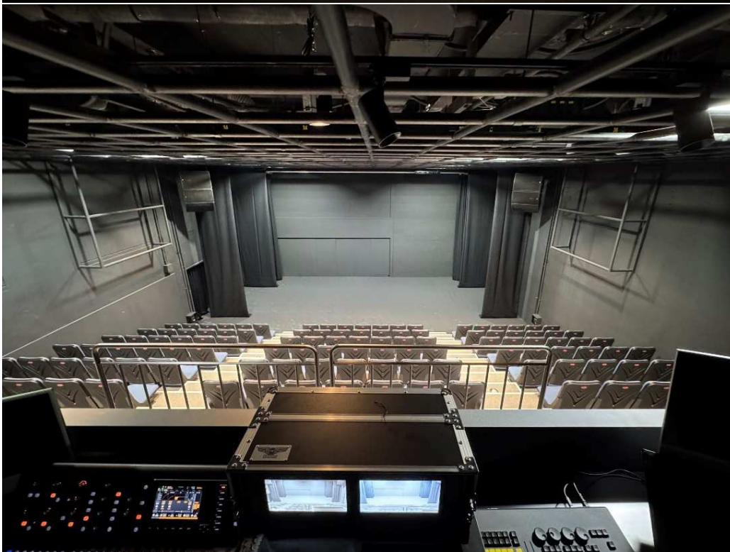
Grid Size(mm) 600 x 600 Pipe \phi 480mm